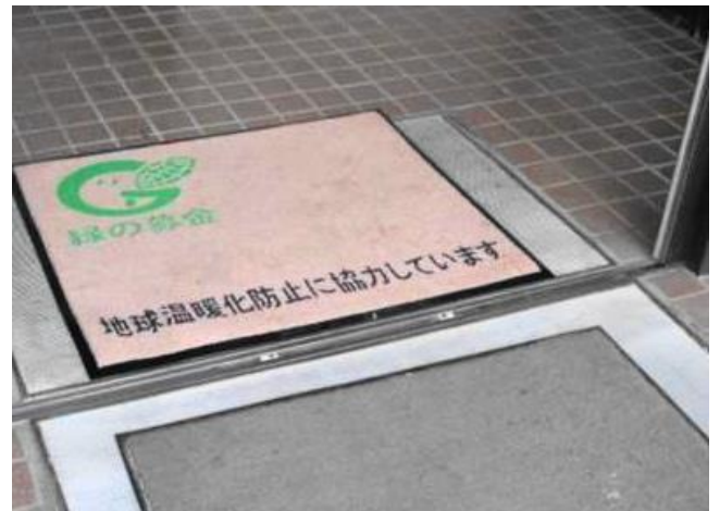
気仙地方森林組合様