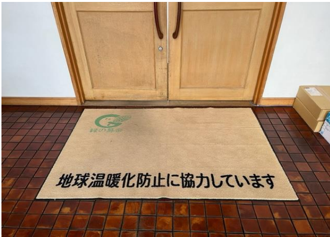
青森県森林組合会館様