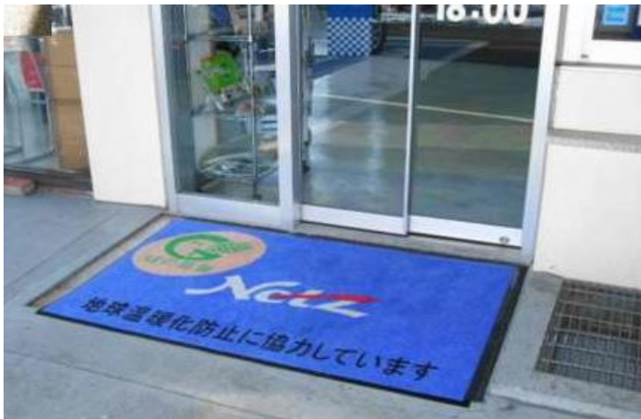
ネットトヨタ岩手みたけ店様