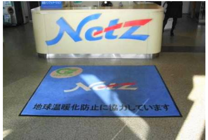
ネットトヨタ本社様